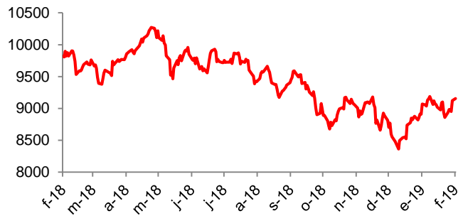
Gráfico del día: Crudo Brent $/Barril